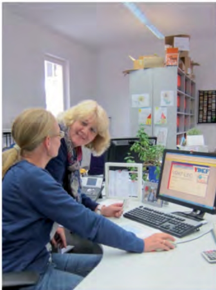
VDKF-LEC in der praktischen Anwendung

VDKF-LEC - die branchen- übergreifende Komplettlösung sowohl für Kleinunternehmen als auch für große Konzerne