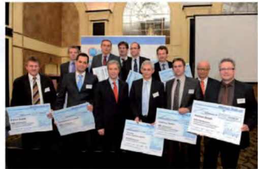
Früherer Bundesumweltminister Röttgen inmitten der Preisträger

Wir freuen uns über die Verleihung des Preises und sehen hierin einen Ansporn, die Entwicklung der mittlerweile zum Branchenstandard gewordenen VDKF-LEC-Software weiter voran zu treiben.